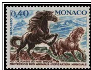
Poneys du pays basque