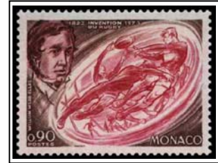
N°929 90c. brun-carmin, brun-violet et carmin