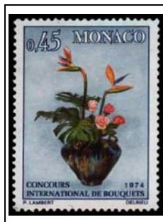
Ikebana à l'occidentale