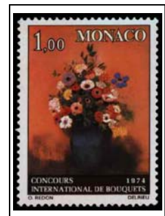
Vase de fleurs