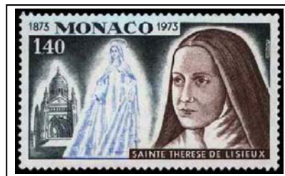
N°930 1f40 gris-bleu, brun-violet et outremer