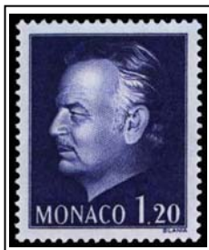
N°995 1f20 violet-brun