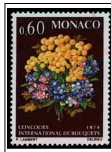
Mimosas et myosotis