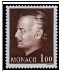
N°994 1f brun