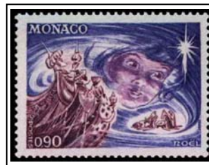
N°902 90c. outremer et lilas