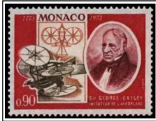
N°928 90c. multicolore