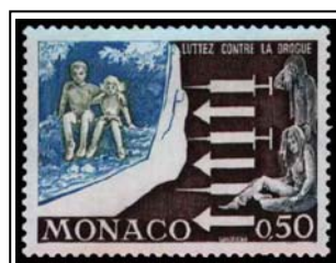
Lutte contre la drogue