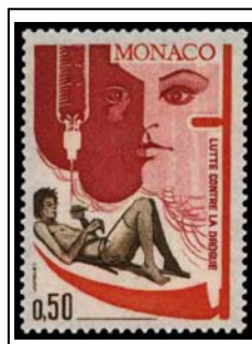
N°903 50c. carmin, orange et brun