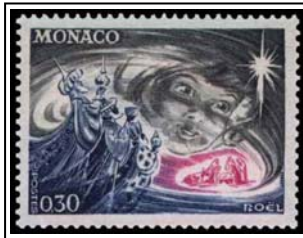
N°900 30c gris, bleu et rose