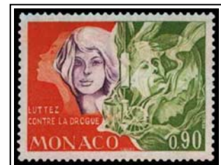
N°932 90c. orange, vert-jaune et lilas