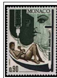
N°904 90c. vert foncé, bleu-noir et brun