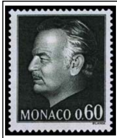
N°992 60c vert et noir