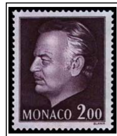
N°996 2f lilas-brun