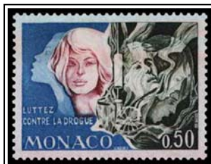
N°931 50c bleu, vert-noir et carmin