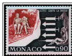
Lutte contre la drogue