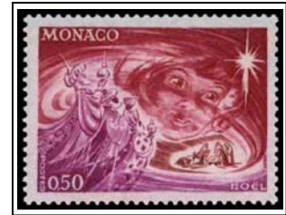
N°901 50c carmin, lilas-rose et brun-violet