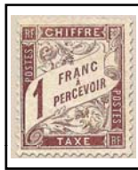
N°TA 25 1 f. marron