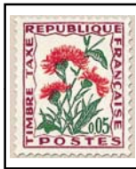
N°TA 95 5 c. lilas, rose, rouge et vert