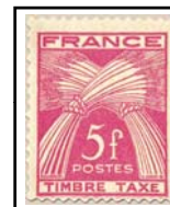
N°TA 85 5 f. rose-lilas