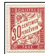
N°TA 33 30 c. rouge carminé