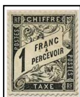
N°TA 22 1 f. noir