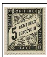
N°TA 14 5 c. noir