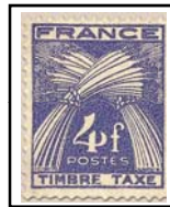
N°TA 84 4 f. violet