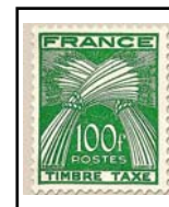
N°TA 89 100 f. vert