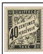
N°TA 19 40 c. noir