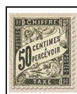
N°TA 20 50 c. noir