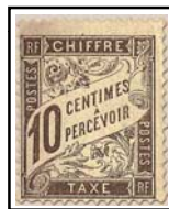
N°TA 29 10 c. brun