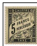
N°TA 24 5 f. noir