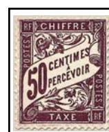
N°TA 37 50 c. lilas