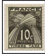
N°TA 78 10 c. sépia