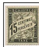
N°TA 16 15 c. noir