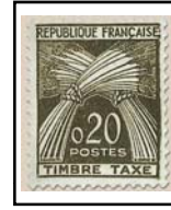
N°TA 92 20 c. brun-olive