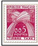
N°TA 90 5 c. rose-lilas