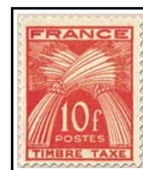
N°TA 86 10 f. rouge-orange