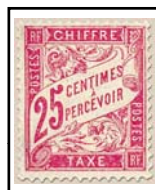
N°TA 32 25 c. rose