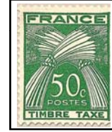
N°TA 80 50 c. vert