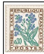
N°TA 99 30 c. brun, vert foncé et outremer