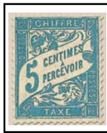
N°TA 28 5 c. bleu