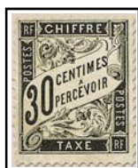
N°TA 18 30 c. noir