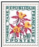
N°TA 100 40 c. jaune, rouge et vert foncé