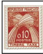
N°TA 91 10 c. orange