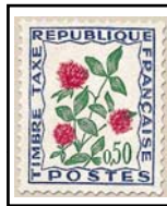
N°TA 101 50 c. outremer, vert et rouge