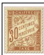
N°TA 34 30 c. rouge-orange