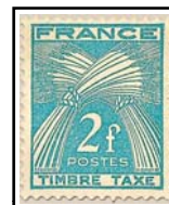
N°TA 82 2 f. bleu-vert