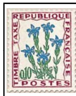
N°TA 96 10 c. carmin, vert et outremer