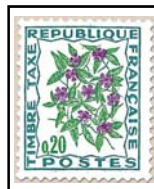
N°TA 98 20 c. mauve, vert clair et vert foncé