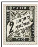
N°TA 11 2 c. noir