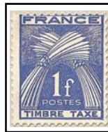
N°TA 81 1 f. bleu-violet