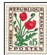
N°TA 97 15 c. brun, vert et rouge