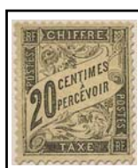
N°TA 17 20 c. noir