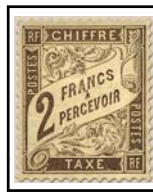
N°TA 26 2 f. marron