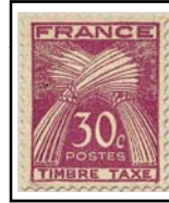
N°TA 79 30 c. lilas-rose