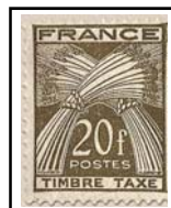
N°TA 87 20 f. brun-olive