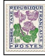
N°TA 102 1 f. outremer, vert et lilas