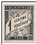
N°TA 10 1 c. noir