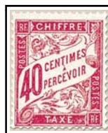
N°TA 35 40 c. rose