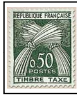
N°TA 93 50 c. vert foncé