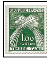
N°TA 94 1 f. vert