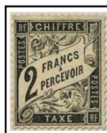
N°TA 23 2 f. noir