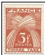
N°TA 83 3 f. rouge-brun