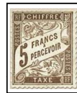
N°TA 27 5 f. marron