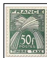
N°TA 88 50 f. vert foncé