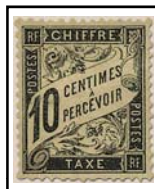
N°TA 15 10 c. noir