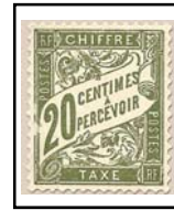
N°TA 31 20 c. olive