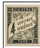
N°TA 13 4 c. noir