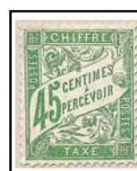
N°TA 36 45 c. vert