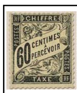
N°TA 21 60 c. noir