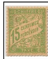
N°TA 30 15 c. vert-jaune