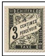
N°TA 12 3 c. noir