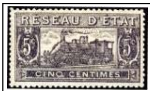
N°CP 9 5c gris