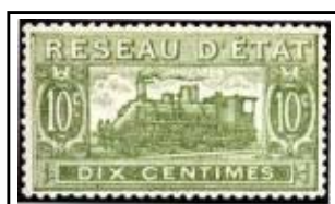
N°CP 10 10c vert pâle