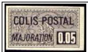
N°CP 23 5c noir

Typographie. Non dentelé Impression plus fine