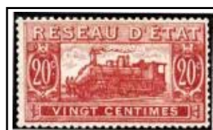
N°CP 11 20c rose pâle