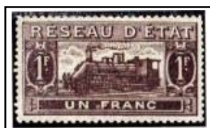
N°CP 13 1f brun