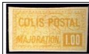
N°CP 27 1f jaune