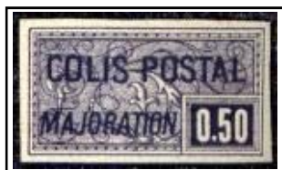
N°CP 26 50c violet-bleu