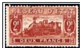
N°CP 14 2f rouge-brun