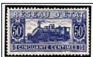
N°CP 12 50c bleu