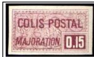
N°CP 24 15c lilas