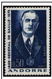
N°224 50c bleu-violet