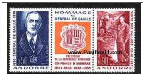
N°225A 50c bleu-violet et 90c carmin bistre