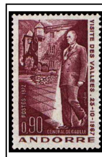
N°225 90c carmin bistre